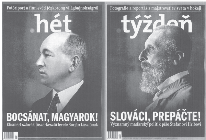
Abbildung 2: Ungarische Rückseite (links) und slowakische Frontseite (rechts) der slowakischen Zeitschrift .tyzden mit der gegenseitigen Entschuldigung (tyzden 2013).

.tyzden, gab im Mai des Jahres eine Ausgabe mit einer slowakischen Frontseite und einer ungarischen Rückseite heraus (siehe Abbildung 2).