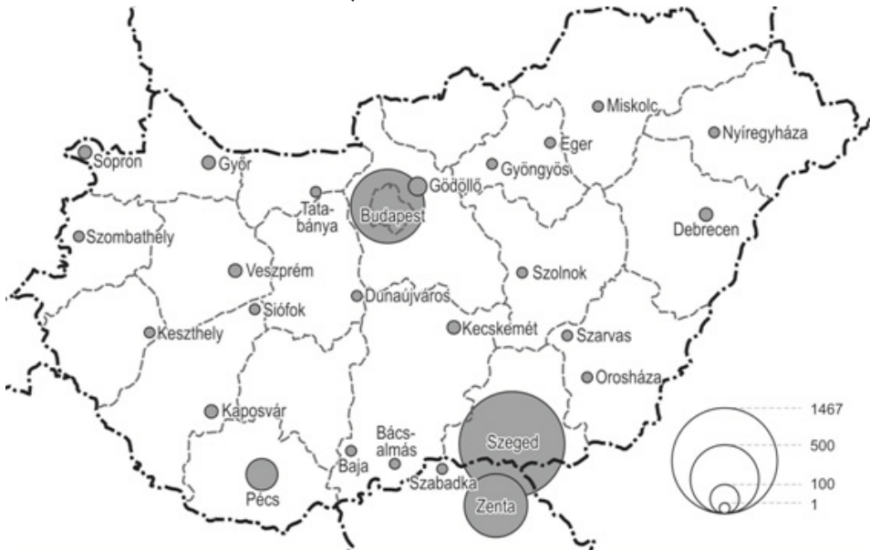
1. ábra: A magyar felsőoktatásba jelentkező szerb állampolgárok az oktatás helyszíne szerint, 2005–2010 (fő)